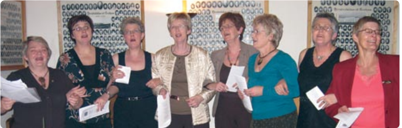
Syngjandi systur í Skagafjarðarklúbbi