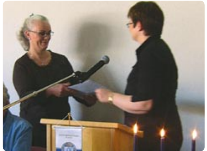
Forseti afhendir formanni Akureyrarklúbbs styrk