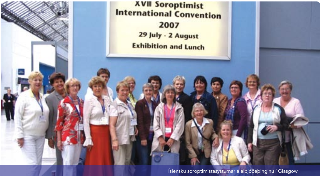
Íslensku soroptimistasysturnar á alþjóðáþingunni í Glasgow