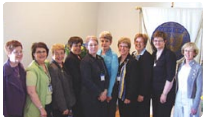
Fyrrverandi, núverandi og verðandi forsetar landssambandsins