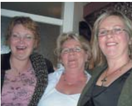
Alltaf gaman hjá systur.

Þó að ég hafi aðeins verið Soroptimisti í þrjú ár og jafnoft farið í Munaðarnes, þá er mér farið að finnast það sérstakt tilhlökkunarefni þegar mánaðarmótin september - október nálgast því þá er Munaðarnesferð í vændum. Auðvitað er ég eins og flestar aðrar systur að vinna alla daga og hlakka til helganna sem ég eyði með fjölskyldu og vinum eða til að gera allt það sem ekki vannst tími til í vikunni. Stundum hefur hvarflað að mér að ég hafi ekki tíma til að fara í Munaðarnes en það er bara vitleysa því þetta geri ég fyrir sjálfa mig og á það skilið. Fer af stað eftir vinnu á föstudegi og er komin heim upp úr hádegi á sunnudegi með skemmtilegar minningar um góða helgi. Við höfum þann háttinn á að þjappa okkur í bíla og verða samferða uppeftir. Þannig gefst okkur kærkomið tóm til að spjalla saman á leiðinni. Við stoppum oftast í Borgarnesi, bæði til að kaupa í morgunmat og fá okkur kvöldmat í Hyrnunni. Þar hittum við venjulega aðrar systur af höfuðborgarsvæðinu og þannig vex tilhlökkun til þess sem í vændum er.