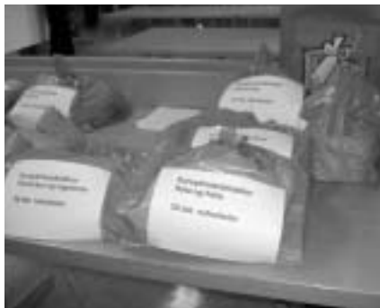
Nafnalistar tilbúnir til afhendingar.