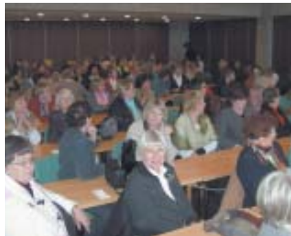
Heimsókn að Bifröst.

Nú var smá hlé til að pússa sig upp fyrir kvöldið en síðan var snæddur hátíðarkvöldverður í Munaðarnesi eins og venja er og þar voru einnig