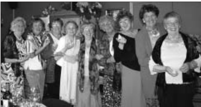
Nú af stofnfélögum.