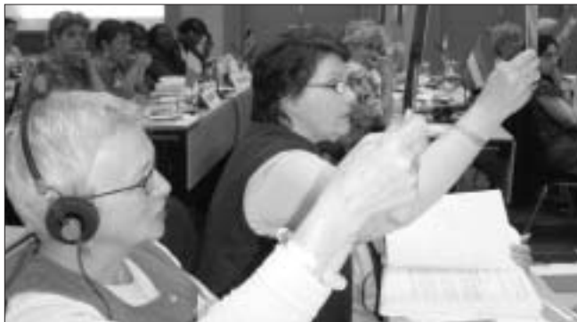
Sendifulltrúar að störfum.

Kjósa þurfti um nokkur embætti og var sá háttur hafður á, að kosningarnar voru meira og minna út allan fundinn, þegar færi gafst á milli umræðuefna. Var þetta frekar ruglingslegt og jafnframt eyðilagði þetta nokkrum sinnum umræður sem voru komnar á gott skrið.