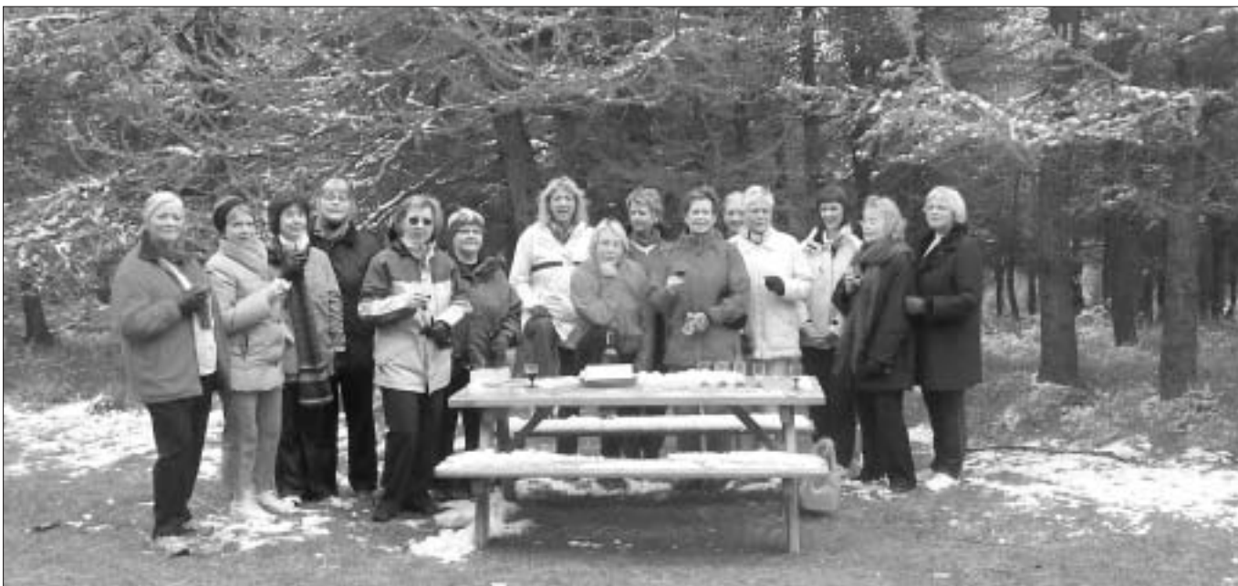
Það er svo gaman að vera saman.