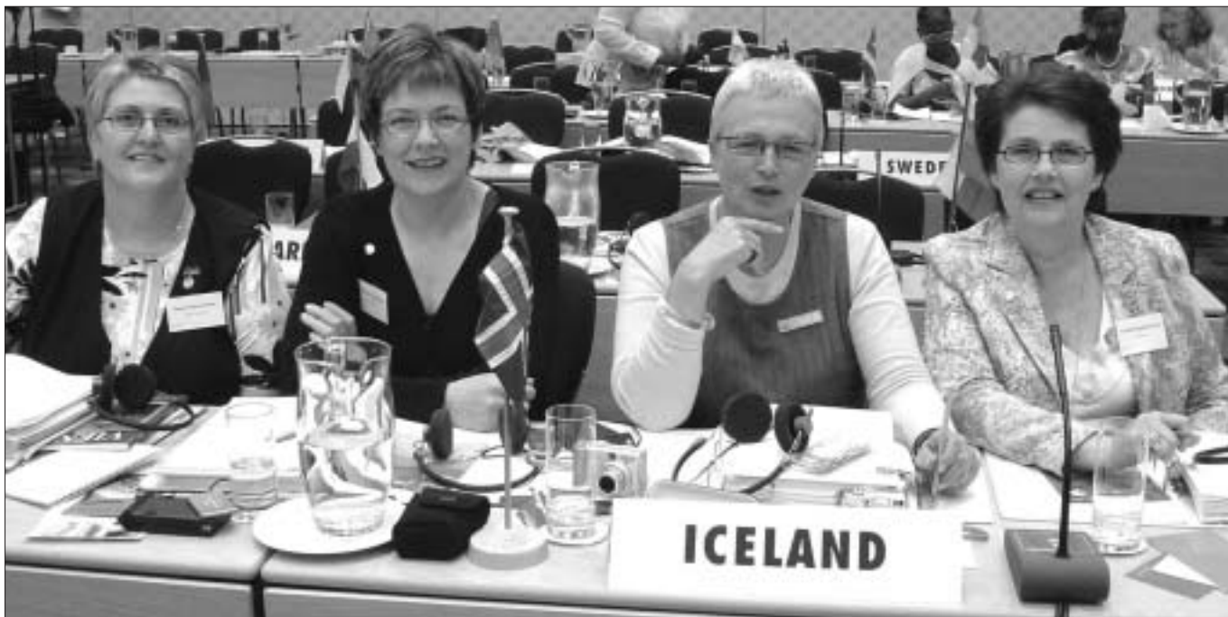
Fyrir Íslands hönd.