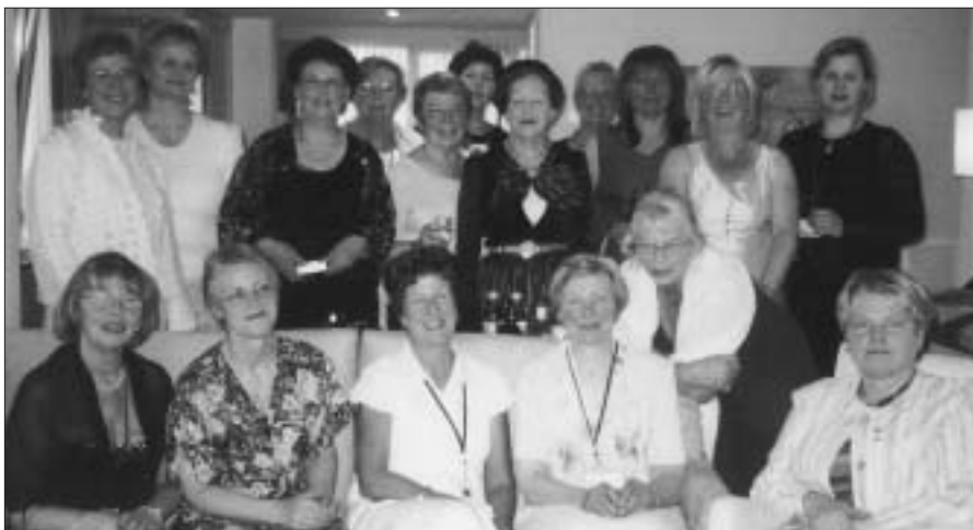
Á leið í hátíðarkvöldverðinn.

Á fyrsta degi okkar í Vín var farið í skoðunarferð í miðborgina. Þar gnæfir Stefánsdómkirkjan yfir borginni, tilkomumikil í gotneskum stíl. Hún brann 1945 en endurreisn hennar lauk 1952. Á torginu fyrir framan kirkjuna og inni í henni er alltaf mannföldi enda er þar margt að sjá og skoða. Sumir setjast og eiga hljóða stund í þessum mikla helgidómi. Þá er hægt að fara upp í turninn með lyftu og sér