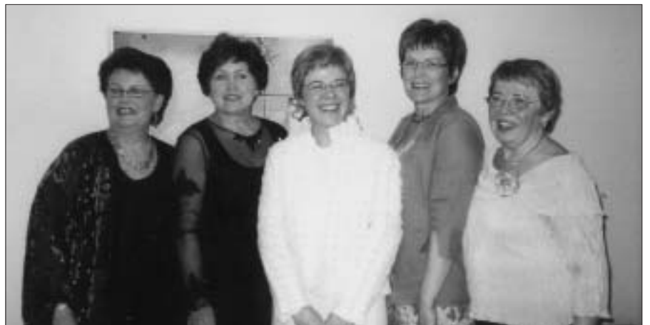
Fimm forsetar SI/Í.