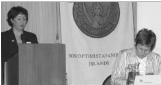
Björk formaður Seltjarnarnesklúbbs býður gesti velkomna.

t.d. vegna kynþáttar, trúar, þjóðernis, þjóðfélagsstéttar eða stjórnmálaskoðana. Samningnum er ætlað að vernda þá sem þurfa að yfirgefa land sitt og samningurinn skuldbindur aðildarríkin til að senda þá ekki til baka ef það er hættulegt öryggi þeirra. Enginn samningur er hins vegar til um þá sem lenda á vergangi.