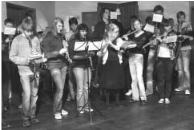
Lúðrasveit tók á móti fundargestum með sama kröftugleika og veðrið.