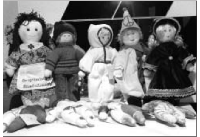
Nokkrar af þeim friðardúkkum sem íslenskir Soroptimistar hafa gert.

Með því að leggja sérstaka áherslu á menntun stúlkna nást mörg markmið. Menntaðar konur eignast færri börn en ómenntaðar en víða er barnamergrð og barnadauði stórt vandamál. Börn menntaðra mæðra eru einnig heilbrigðari. Síðan las Rannveig smá kafla úr sögu Leilu, bosniskrar