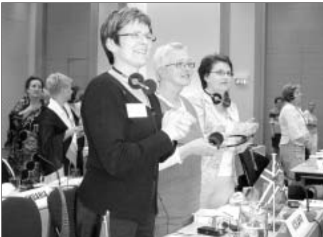
Þetta var góð niðurstaða.