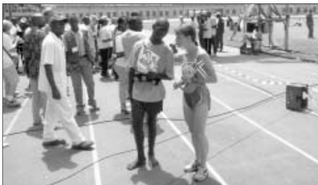
Bryndís og pilturinn sem hljóp berfættur með henni allt hlaupið.

Á undirbúningstímanum hafði sú hugsun stundum skotið upp í kollinum á mér að friðarmaraðon væri eitthvað sem fyrst og fremst liti vel út á pappírnum. Góð leið fyrir velmegandi Vesturlandabúa að sýna svolitinn samhug með stríðshrjádum löndum í fjarlægum heimsálfum, en hefði lítið vægi til að koma á friði í heiminum. Þegar hér var komið sögu og ég hljóp um götur Kigali fékk ég allt aðra tilfinningu fyrir uppátækinu. Á ferðum mínum um Rúanda fram að þessu hafði ég fundið mjög sterkt fyrir því að ég átti ekki heima þar. Ég var öðruvísi á litinn, kom frá fjarlægum landi í öðrum menningarheimi. Hvar sem ég kom truflaði ég mannlífið með nærveru minni og ég gat engan veginn fallið inn í hópinn á staðnum. Meðan á hlaupinu stóð leið mér vel meðal heimamanna og það var nánast í eina skiptið í ferðinni sem mér fannst ég falla inn í hópinn. Þar voru allir að gera það sama, hvort sem þeir voru hvítir eða svartir, ríkir eða fátækir, ungir eða gamlir. Meðfram brautinni stóðu borgarþegar og kölluðu hvatningarorð til hlaupara jafnt sem heimamanna og gesta. Hugmyndin um hlaup sem sameiningartákn sannaði gildi sitt fyrir mér.